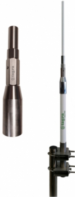
Racor inoxydable Stainless fitting Raccord inoxydable