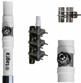
Détail connecteur et montage