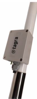
Boîte BOX HF-1 (non inclus)