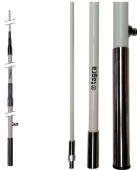
Trois sections de montage (1 x 3 m. et 2 x 2,25 m.)