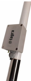
Boîte BOX HF-1 (non inclus)