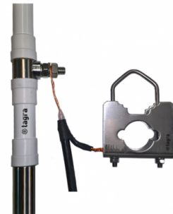
Exemple de connexion