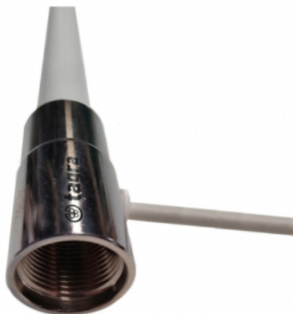
Détail de connecteur