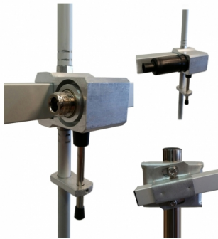
Détail de connecteur et support