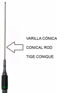
VARILLA CÓNICA CONICAL ROD TIGE CONIQUE