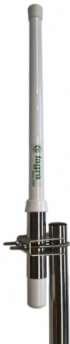
Tube et suport en INOX