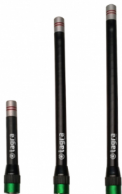
Différents modèles disponibles