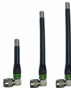
Différents modèles disponibles