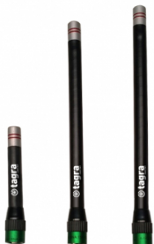
Différents modèles disponibles