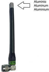
Différents modèles disponibles