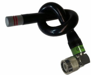
Différents modèles disponibles