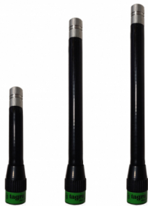
Different models available