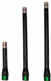
Différents modèles disponibles