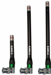
Différents modèles disponibles